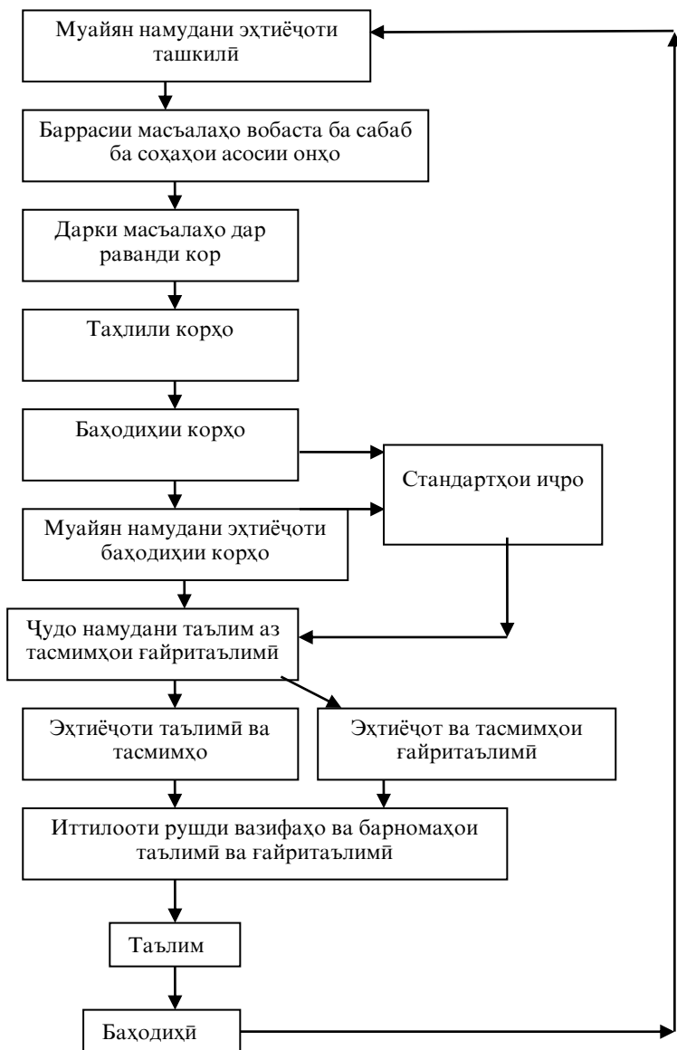
Чадвали 3. Сикли таълимии идоракуни ба иҷрои таҳлили пробле- маҳо асос ёфтааст.