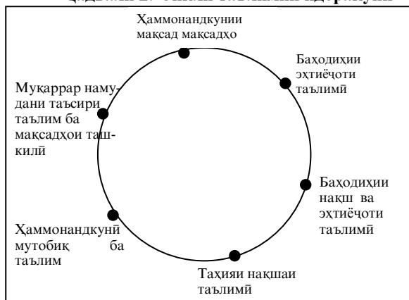
Чадвали 2. Сикли таълимии идоракунии

Чадвали 2 силсилаи раванди таълимии идоракунии сикло дар сатҳи стратегӣ инъикос менамояд. Зинаи якум бояд мақсад ва вазифаҳои рушди давлат ва ҳар қадам ташкилотҳо тавзеҳ диҳад. Мақсад ва вазифаҳо бояд дар ҷараёни мӯҳлати муайяни вақт (муайян, ҷеншаванда, ноилшаванда, воқеӣ ва саривақтӣ) баён карда шаванд. Зинаи дуюм ҳаммонандкунии донишро тақозо менамояд, ки бояд ба вазифаҳои зикргардида ноил гардад. Дар зинаи сеюм ҷенаки воқеии дониш ва корҳои воқеиро дониш муайян менамояд, ки дар зинаи дуюм ҳаммонанд гардонида шудаанд. Дар зинаи чорум ташкилот бояд нақшаи таълим ва рушдро тарҳрезӣ намояд, ки натиҷаҳои зиннаи дуюм ва сеюмро ба инобат мегирад. Дар сатҳи давлатӣ он бояд боиси натиҷаҳои фармоиши давлатӣ марбут ба таҳсил дар муассисаҳои таълимӣ, ки таҳти моликияти давлат қарор дорад ё нисбат ба истинод