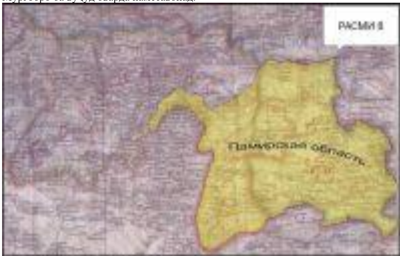
Рисун 4. Ҷағираи таърихӣ ва ҳаҷри ҷағриӣ дар минтақаи Русия ва Ҷумҳурии Тоҷикистон ва Қирғизистон ва Ўзбекистон дар соли 1925.

Баҳши сарҳади байниавлатӣ дар минтақаи Мурғоб низ дар раванди таъсиси ҷумҳуриҳои Осиёи Марказӣ ба таври ниҳой тасдиқ шудааст ва ин минтақа аз 2-юми январи соли 1925, яъне баробари таъсиси ВМКБ ба таркиби Тоҷикистон шомил буда, нисбат ба он ҳеҷ баҳсе вуҷуд надорад. Изҳороти баъзе намояндагони ҷониби Қирғизистон дар бораи ин, ки «агар ба ҳуҷҷатҳои солҳои 1924-1927 таъя кунем, он вақт Мурғоб ҷузъи қаламрави Қирғизистон буд», комилан беасос буда, баръакси ин, маҳз тибқи ҳамин ҳуҷҷатҳо Мурғоб ҷузъи таркибии Ҷумҳурии Тоҷикистон гашта, ин баҳши сарҳад ҳам расмияти сатҳи ҷумҳурӣ ва ҳам расмияти сатҳи ниҳоди олии қонунгузори ИҶШС-ро гузаштааст. Яъне, масъалаи «ҳуҷҷатҳои солҳои 1924-1927» ҳаргиз баҳси Мурғобро ба вуҷуд оварда наметавонад.